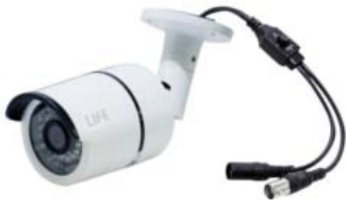
N.B. La foto è solo rappresentativa

Non smontare per nessun motivo la telecamera. Se la telecamera non funziona correttamente contattare il servizio tecnico.