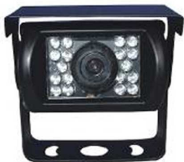
N.B. La foto è solo rappresentativa

Non smontare per nessun motivo la telecamera. Se la telecamera non funziona correttamente contattare il servizio tecnico.